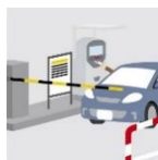
出口精算機で精算